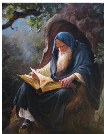
“The Intellect” – Jim Warren